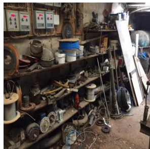
Huoltovarasto ennen 5S

Kun käytetään prosessijohtamista, sitä on noudatettava kokonaisuutena johdosta työntekijöihin asti. Usein tueksi tarvitaan johtamistaitoon erikoistunut konsultti.